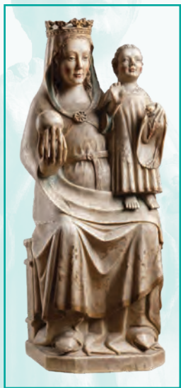
Anònim. Mare de déu amb el Nen. Procedent del Monestir de Sant Miquel del Fai (Barcelona), cap a 1330-1340

Les dones de la vida de Jesús foren erigides com a models de feminitat durant l'etapa medieval. L'Església projecta la figura de la Mare de Déu com a exemple universal per a les dones i en el cristianisme redimia el pecat original comès per Eva en el Gènesi. Nativitats i resurreccions són dues de les escenes dels evangelis en què la Verge Maria és mostrada com a mare i esposa, i anirà prenent la forma de mare sofrent en l'escena de la davallada de la Creu. Maria Magdalena en serà la contrapart, interpretada com a dona pecaminosa i redimida.