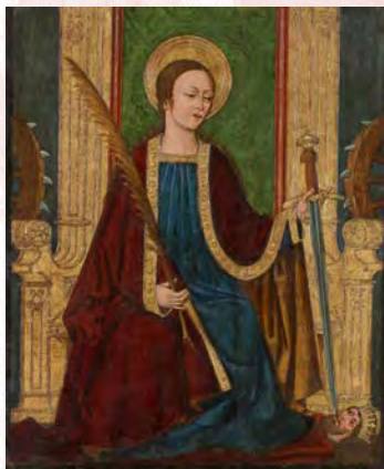
Mestre d'Armisen. Santa Caterina d'Alexandria. Procedent de l'ermita de Sant Salvador de Tarassona (Saragossa), últim Quart del segle XV

Santa Caterina d'Alexandria i de Santa Àgueda de Catània (representades al retaule de l'ermita de San Salvador de Tarassona, a Saragossa) són santes de l'època en què el cristianisme és perseguit i deriven de les màrtirs, dones que van ser torturades per la seva fe, tot i que van mantenir la castedat. La virginitat va mobilitzar significants ambivalents per a les dones: d'una banda, les alliberava del mandat de la família i el matrimoni, però, de l'altra, els penalitzava l'expressió sexual.