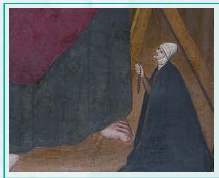
Mestre de Maluenda. Retaule dedicat a Sant Andreu, Sant Miquel i Sant Gabriel. (detall) Procedent de l'església parroquial de Santa Maria de Maluenda (Saragossa), tercer quart del segle XV

Moltes de les dones que entre els segles X i XVII van dedicar-se a les arts van fer-ho precisament a través del “matrimoni amb Déu”: es van fer monges; d'aquí ve l'ambigüitat que l'Església com a institució va tenir per a les dones. Les pintures de naixements també assenyalen la seva activitat com a llevadores i sabem que algunes foren metgesses. Les corts van ser, amb l'Església, un altre recer per a l'activitat creativa de les dones. A més, dones riques i nobles, generalment vídues, van ser importants mecenes de l'art, que trobem representades als retaules.