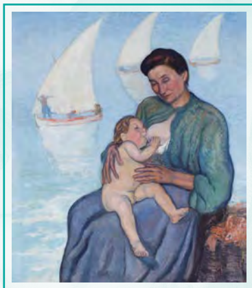
Joaquim Sunyer i Miró. Maternitat . Sitges, 1908

El Noucentisme va ser un moviment que apostava per construir un nou model cultural i social de país. Els ideòlegs van projectar també el model de dona ideal que havia de nodrir la nació. Es tornava a ideals classicistes per propiciar una feminitat discreta, educada, amb seny, conservadora i alineada amb el model de La Ben Plantada , esposa i mare abnegada d'una societat burgesa que volia ennoblir-se.