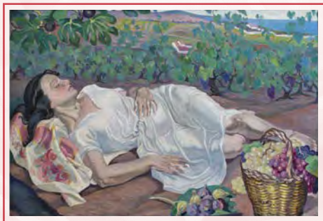
Lola Anglada i Sarriera. Descans , 1926. Dipòsit del Fons Historicoartístic de la Diputació de Barcelona

Lola Anglada (1892-1982) és una de les artistes catalanes més interessants del segle XX. La seva diversa obra reflecteix la lluita contra la doble opressió de ser dona i republicana durant la Guerra Civil i el franquisme. Més enllà que mostra com la representació del cos femení pren força quan el pinzell el fa anar una dona, també va dedicar obra al menystingut públic infantil i juvenil, a través de la il·lustració de contes i revistes com La Nuri .