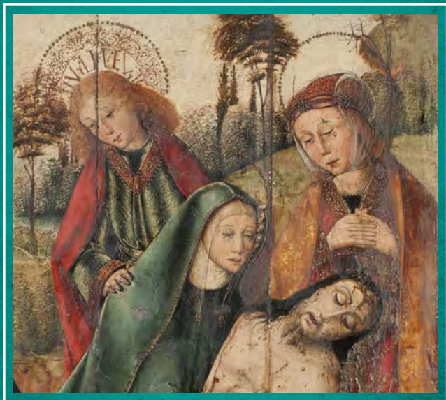
Anònim. Pietat (detall) Palència, segle XV

Allò que avui anomenem art al llarg de la història ha servit per idolatrar déus i deesses, per reunir la comunitat, per fer pedagogia o propaganda, per ennobrir palaus, temples i cases o per fer negoci. Avui als museus hi trobem les obres lluny dels entorns pels quals es van crear, cosa que dificulta comprendre què hi ha a l'origen i com es van relacionar amb les persones del passat.