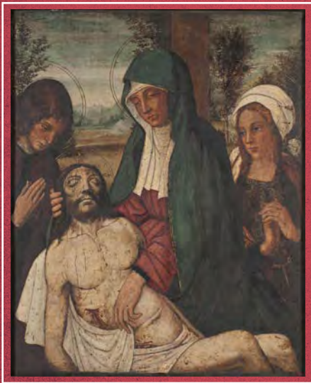
Anònim. Pietat . Castella, segle XV

A partir del Concili de Trento, Maria Magdalena agafarà pes com a model de dona, perquè podia representar totes aquelles dones – i altres persones – que no podien aspirar a la virtuositat de Maria. Per això, en processos judicials contra la moral i el bon comportament de les dones, no era infreqüent que aquestes apel·lessin a Maria Magdalena com una imatge que podia inspirar el perdó.