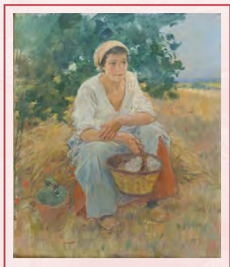
Arcadi Mas i Fondevila. Noia al camp, cap al 1900

En la seva preocupació per captar la llum i l'atmosfera de Sitges, els pintors de l'Escola Luminista van plasmar amb realisme els paisatges i la vida quotidiana de la vila. Les pintures mostren la importància del treball femení a Sitges durant una lenta industrialització que convivia amb les feines agràries i del mar. Poc després, el Modernisme va representar les dones treballant a les fàbriques.